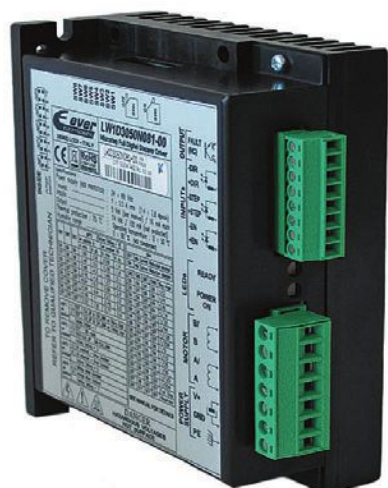
Рис. 1. Драйвер LW1D3050N081-00 ориентирован на управление двухфазными шаговыми двигателями

Данный драйвер ориентирован на востребованный диапазон токов возбуждения обмоток (5,5 А – усредненное значение, а 7,8 А – пиковое значение), в нем предусмотрено цифровое управление и режим микрошага, при этом он отличается хорошим соотношением «цена/качество» и может быть рекомендован для широкого применения. MA